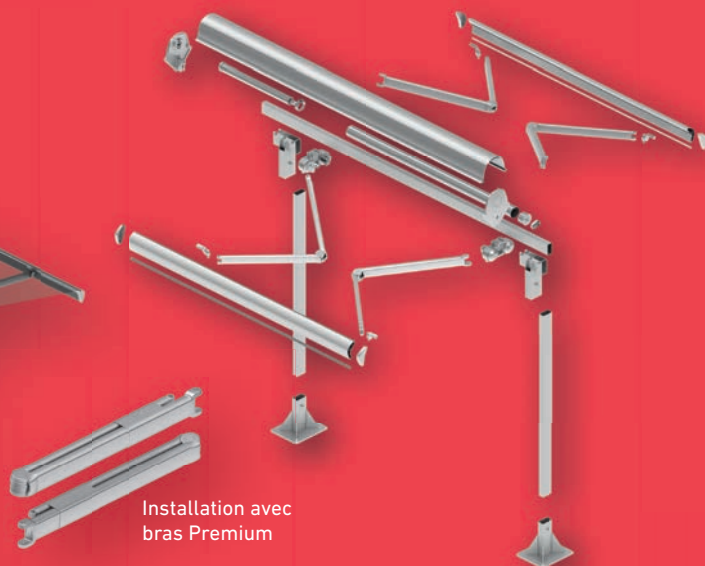
Installation avec bras Premium

Limites d'utilisation: De 6 mètres de largeur par 3 mètres de hauteur et bras de 3 mètres